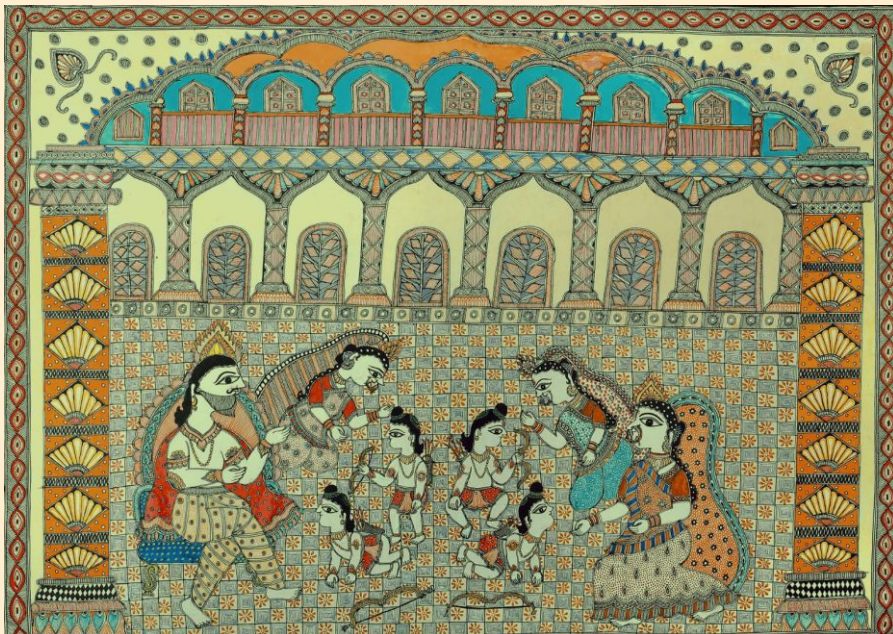
विभा कैलाजे, मुम्बई