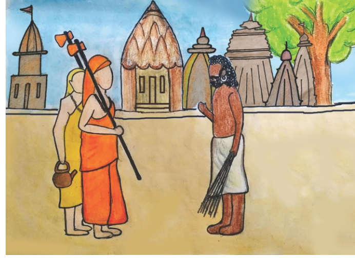
संविता-समीक्षा हट्टङ्गडी , पुण्यनगरी

विप्रोऽयं श्वपचोऽयमित्यपि महान् कोऽयं विभेदभ्रमः ॥